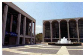
リンカーン・センター Lincoln Center

音楽、演劇、舞踏などのニューヨーク最大の総合芸術文化センター。ウエストサイド・ストーリーの舞台となったかつてのスラム街を再開発して誕生した。