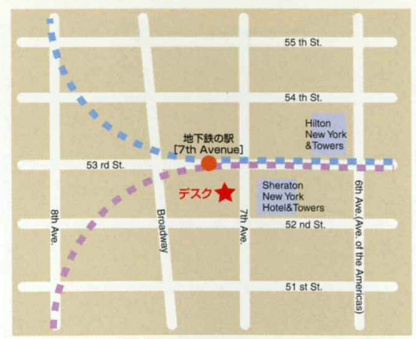
「KYODOトラベルクラブ海外デスク・ニューヨーク」 JAカード会員のための海外トラベルサービス窓口です。各種ツアーなどの予約・手配の代行も承ります。 TEL.1-800-378-5398 (フリー) 営業時間 / 9:00~17:30 (年中無休 / 土・日・祝祭日は電話対応のみ) 810 7th Ave., 33rd FL., New York, NY 10019, USA (JTB支店内)

旅に役立つマメ知識 アメリカではサービスを受けた場合は、チップを渡すのが通例。大体料金の相場の15~20%が相場。州税が8.625%なので、税額の2倍が目安となる。日本などへ国際電話をかけるときは、011(国際電話識別番号)-81(日本の国番号)-市外局番(最初の0をとる)-相手の番号となる。尚、ニューヨークにはKYODOトラベルクラブの海外デスクがあるので、各種ツアーの手配や観光の案内に是非役立てたい。