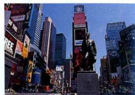
タイムズスクエア Times Square

音楽、演劇、舞踏などのニューヨーク最大の総合芸術文化センター。ウエストサイド・ストーリーの舞台となったかつてのスラム街を再開発して誕生した。