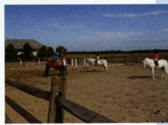
ツゥー・ツリーズ・ ステイブルズ Two Trees Stables 849 Hayground Road, Box 1020 Bridgehampton, NY 11932 TEL.1-631-537-3881