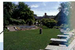
ザ・ベーカー・ハウス 1650 The Baker House 1650

イーストハンプトンに佇む小さなラグジュアリーホテル。知人の別荘を訪れたような気分がさせてくれる。